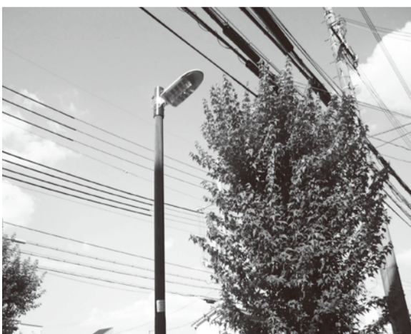
現在設置されているLED防犯灯