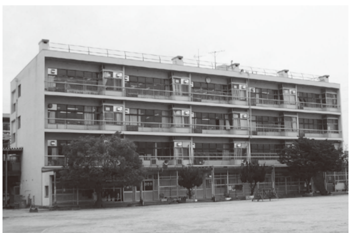
耐震補強工事を行う梶小学校校舎棟

議案第29号、第32号は満場一致で可決しました。議案第35号は賛成多数で可決しました。