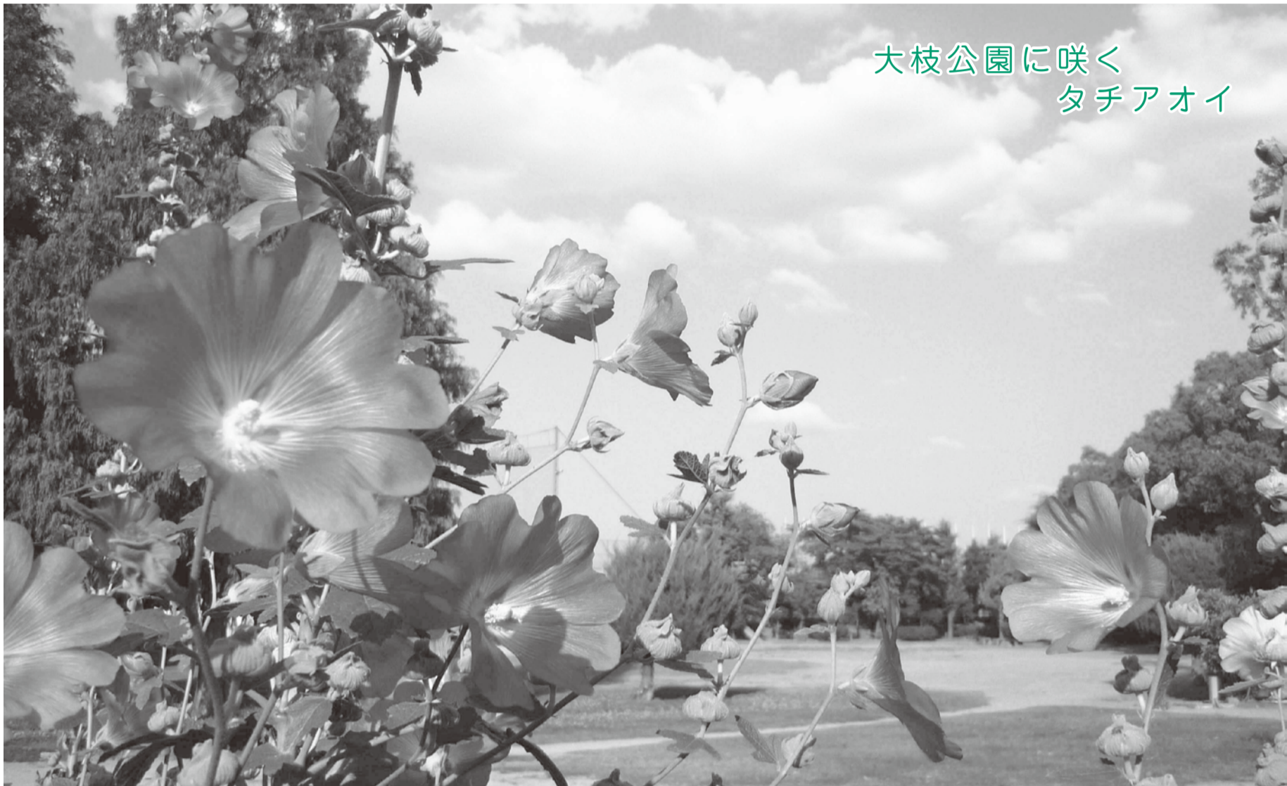
大枝公園に咲く 夕チアオイ