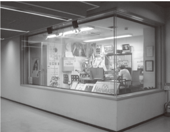
守口文化センター地下 エフエムもりぐち