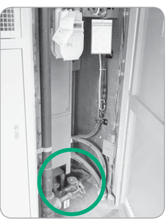
各戸メーターが 設置された パイプスペース