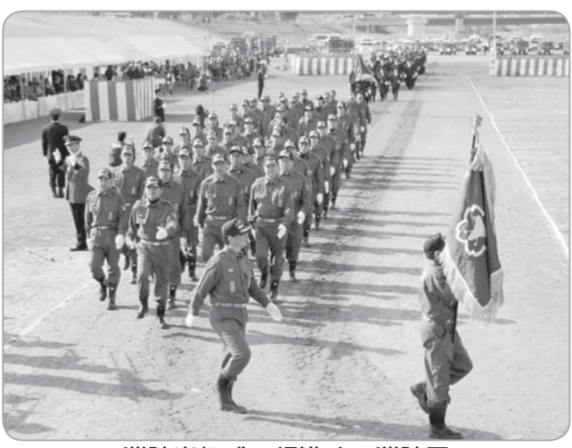
消防出初式で行進する消防団