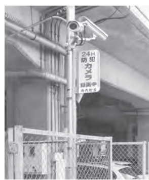
市内に設置された防犯カメラ

【答弁】防犯カメラの設置については、平成23年度に警察が街頭犯罪抑止に効果があると認める付近などに地元町会などの協力を得て設置した。設置後に警察と連携し、効果の検証を行っている中で、市内の街頭犯罪の認知件数が減少していることから、効果が一定認められている。今後は、広く市民の要望や警察などの意見を基に、地元町会などの協力を得る中で、順次増設に努めていく。