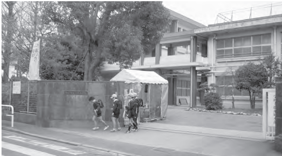
下校時の小学校校門周辺の様子

〔総務市民委員会審査〕 庁舎建設資金積立基金への繰戻しなどについて審査され、特段の異論もなく、満場一致により可決されました。