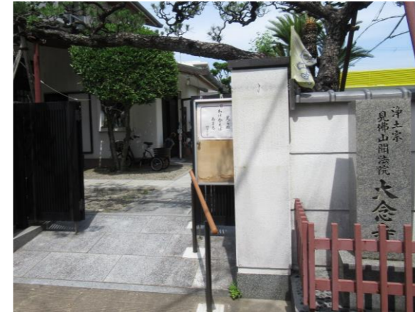
だいねんじ ⑦大念寺