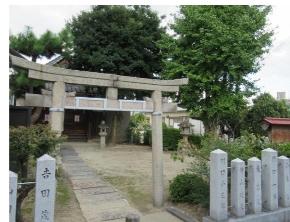
とうだてんしゃぐう ⑨藤田天社宮