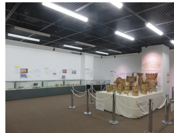
きょうどしりょうてんじしつ ⑪守口市郷土資料展示室