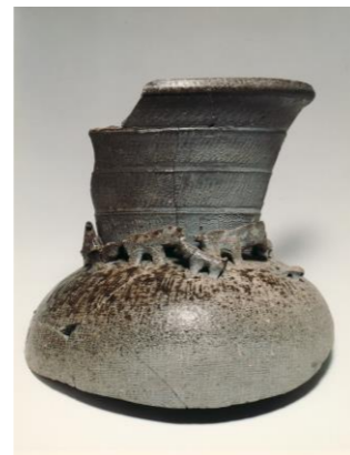
装飾付器台 須恵器