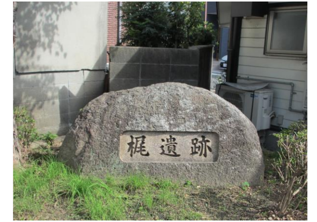
かじいせき (工) 梶遺跡