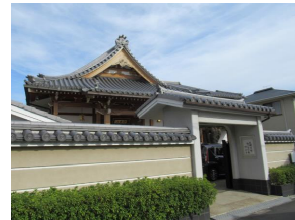
みょうらくじ ⑥妙楽寺