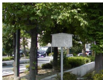
市営住宅敷地内の梶遺跡説明板