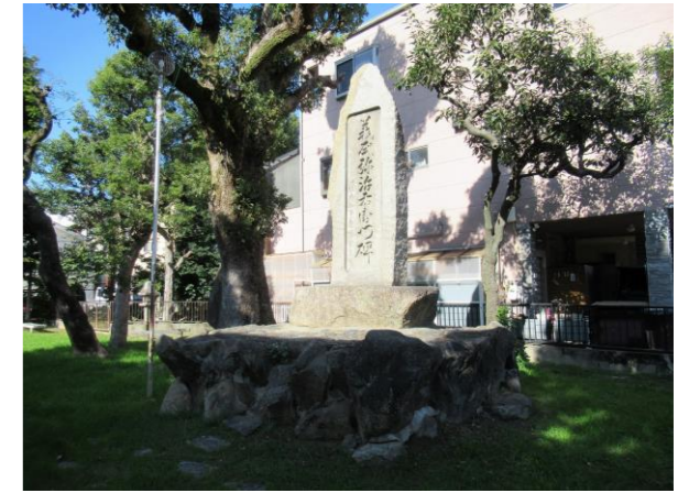
やじえもん こうえん ⑩弥治右衛門公園 (石碑)