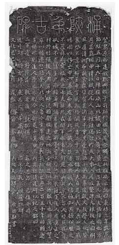
中西家文書「桶狭間弔古碑」の拓影図

また、当家に伝わったのが「中西家文書」で、この古文書は平成13年に市への寄贈があり、『愛知県史』でも紹介された貴重な資料群です。平成27年に市指定有形文化財に指定しました。