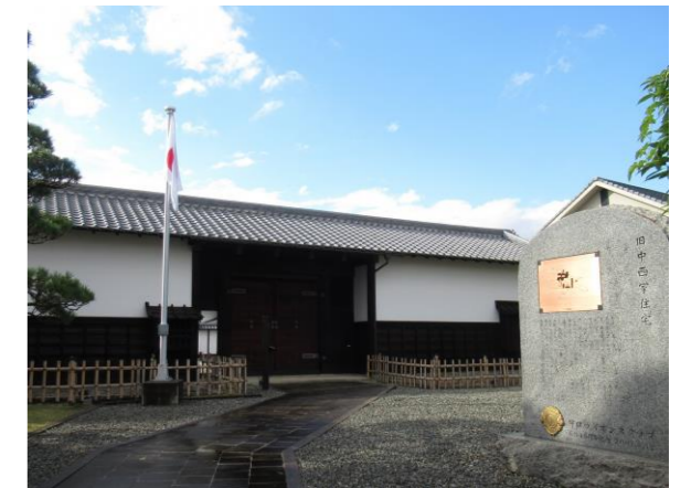
れきしかん きゅうなかにしけじゅうたく ⑧もりぐち歴史館「旧中西家住宅」