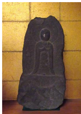
石造地藏菩薩立像

当寺にある石造地藏菩薩立像は享禄5年(1532)の和泉砂岩製で本市の貴重な石造美術品といえます。絹本著色阿弥陀三尊来迎図は室町時代初期頃のものとしてされています。