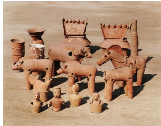
出土した埴輪

古墳時代から中世に至る複合遺跡で、3基の古墳をはじめ、土坑墓や溝などが発見されています。このうち梶2号墳は、6世紀初頭のもと考えられる全長約37mの帆立貝式前方後円墳で、周溝内から、円筒埴輪・朝顔形埴輪のほか、国内で2例目の出土となった珍しい牛形埴輪をはじめ、人物・鹿・猪・馬・家などの形象埴輪が多数出土しました（現在、守口市郷土資料展示室にて公開中です）。また埴輪とともに「首輪をした犬」の装飾付須恵器壺なども出土しており、これらは平成10年に市の有形文化財に指定しました。