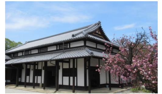
旧中西家住宅 主屋

平成10年に市有形文化財に指定し、修復・保存工事を行い、現在のもりぐち歴史館「旧中西家住宅」として公開しています。