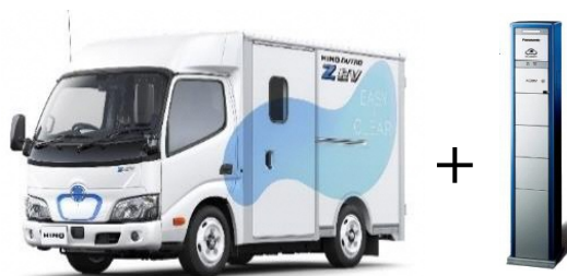
EVトラック（充電設備を含む）