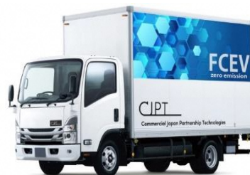
FCトラック（※8トン未満に限る）