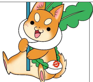
守口市シンボルキャラクター もり吉

守口市では高齢者の方々が特殊詐欺被害に遭うことのないよう、電話通話の自動録音機器の 無料貸出し を行っています。