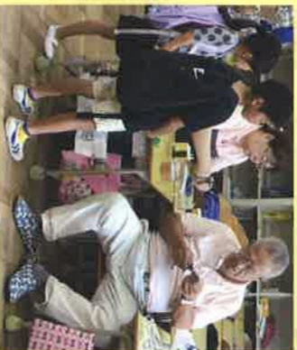
今年もたくさん 子どもたちが遊びに きてくれました