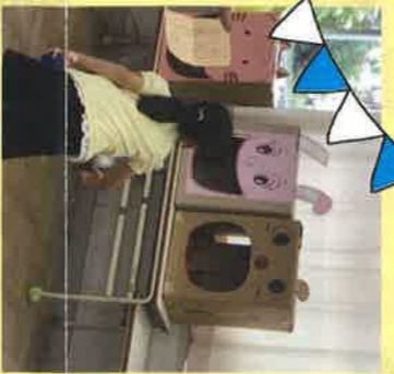
こらやっつて飛ばすよ