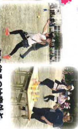
缶を釣るのは意外とむずかしい？