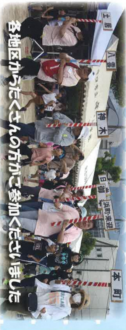
各地区からたくさんの方々が参加くださいました