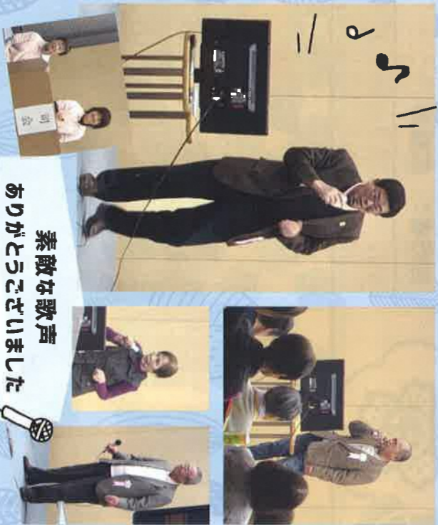
素敵な歌声 ありがとうございました