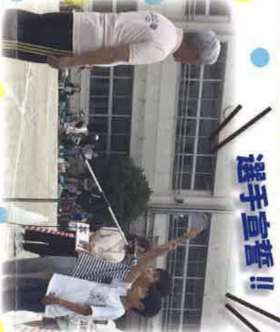
一生懸命がんばります！