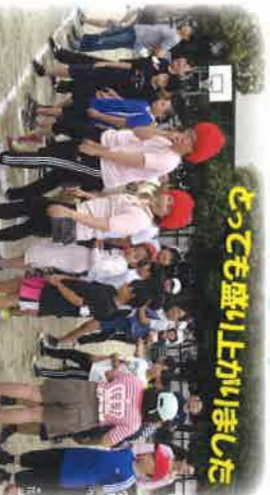
とっても盛り上がりました