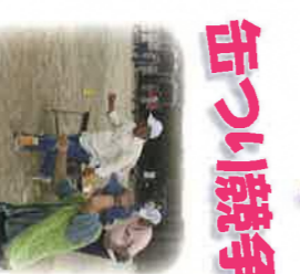
落とさずおぼよう...