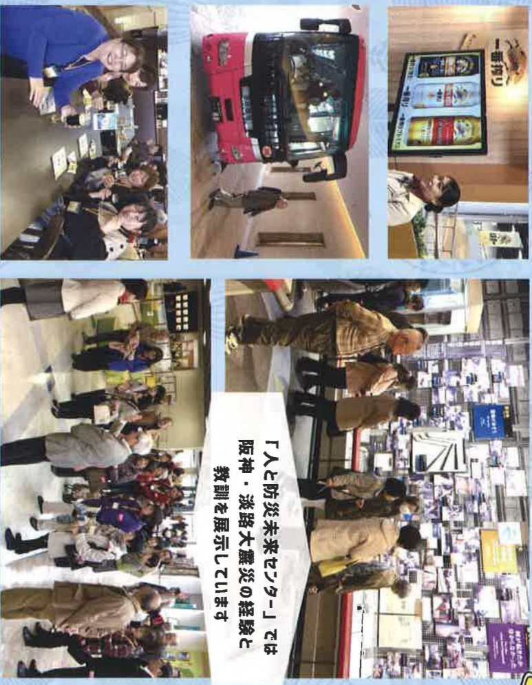
「人と防災未来センター」では 阪神・淡路大震災の経験と 教訓を展示しています