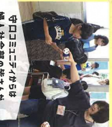
守ロコミュニテイからは 婦人社会部の皆さんが 出し物を企画してあります