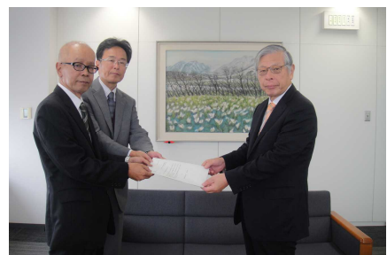
提言書を收受する首藤教育長(右)及び提出する町田会長(左)・蔵楽副会長(中央)