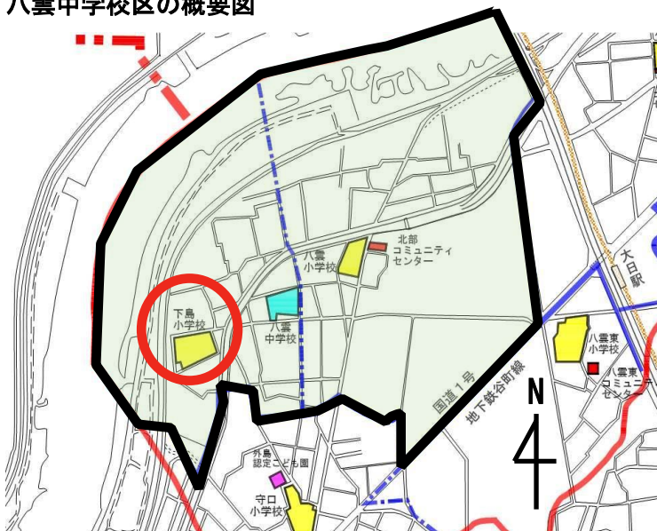
八雲中学校区の概要図