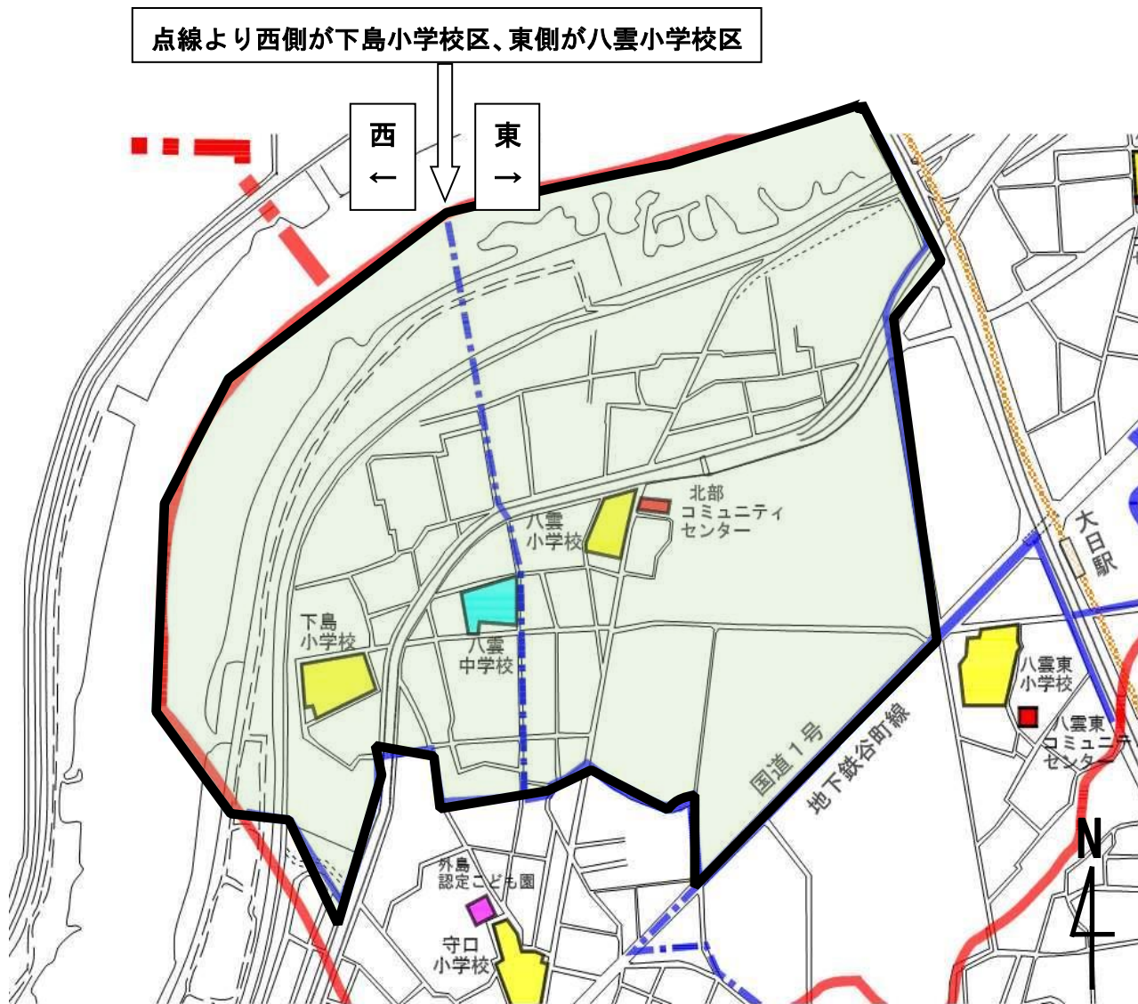
八雲中学校区図（黒太線内）

八雲中学校区は、八雲中学校が校区のほぼ中央に位置し、八雲中学校より西側が下島小学校区、東側が八雲小学校区となっています。