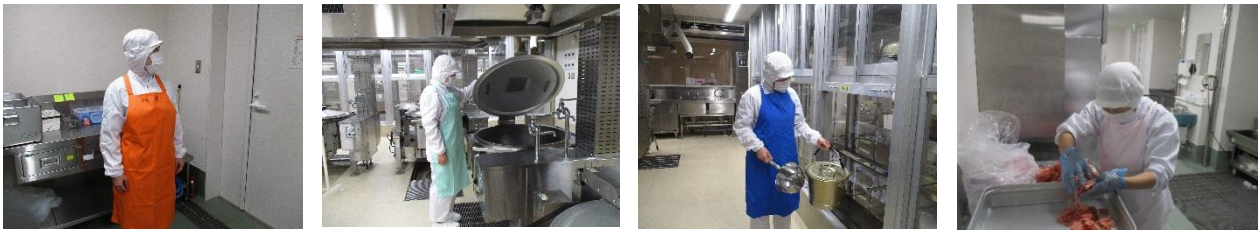
色分けの例:検収(オレンジ)、調理(緑)、配缶(青)、肉用(ピンク)

上記以外にも各学校では HACCP 方式の考え方にに基づき、給食業務を実施しています。HACCP 方式とは、調理工程のあらゆる段階で発生する可能性のある、微生物汚染や異物混入などの原因やリスクをあらかじめ分析し、調理工程のどの段階でどのような対策を講じればよいかを定め、これを連続的に監視することで食品の安全性を確保する衛生管理手法です。各工程の正しい温度管理と作業記録は非常に重要です。各学校では、調理した食材が十分加熱されているか、食材の温度確認はもちろん、冷蔵庫の温度記録や調理機器の点検記録、室内の温湿度記録なども行っています。