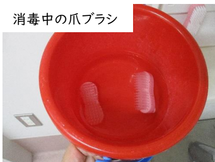
消毒中の爪ブラシ