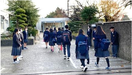
執行部及び評議委員