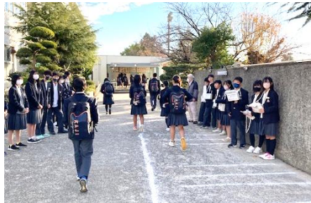
会計委員会と共に