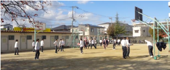
バスケットボールの様子

早いもので、12月となり、2学期も残すところあと3週間となりました。11月は、インフルエンザが流行し、2年生では、学年閉鎖をしなければならない状況が発生し、福祉体験学習も中止せざるを得ない状況でした。しかしながら、登校している生徒たちは、体育の授業で持久走を頑張ったり、昼休みには、多くの生徒たちがグラウンドへ出て、バスケットボールやサッカー、バレーボール、ボール投げなど元気に活動してくれています。寒さに負けず、元気一杯に過ごしてほしいと思います。