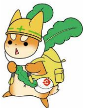
守口市シンボルキャラクター もり吉

13:00～15:30 は、運動場（雨天時は屋内）で 梶中学校区の自主防災訓練を実施します。