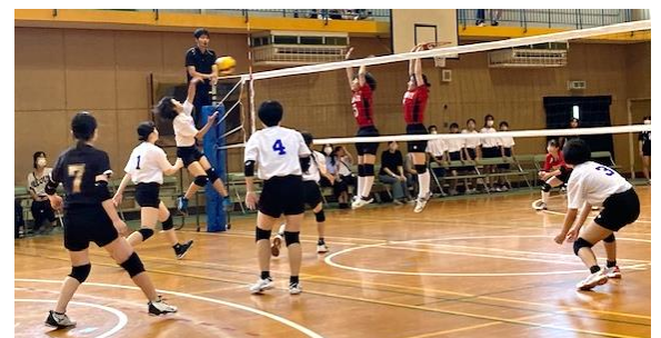
女子バレーボール部公式戦の様子