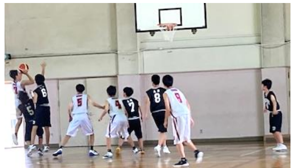
男子バスケットボール部公式戦の様子

キャンペーン期間以外でも、日々、各教室においてベルマークの回収を行っていますので、生徒たちの学校生活の充実のため、今後ともご協力いただきますようお願いいたします。