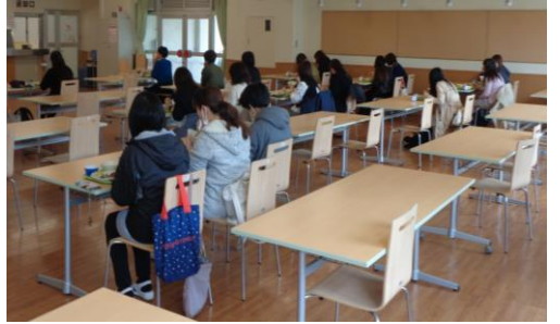
給食試食会の様子

4年ぶりに実施した試食会では、22名の方にご参加いただきました。今回は、アンケートも取らず、ただ食べていただき、中学校給食とはどのようなものなのかを知っていただくための開催でしたが、保護者の方々からは「美味しかった」という声も聞かせていただきました。昼食は、保護者の方々や生徒自身がお弁当が1番だと考えていますが、コンビニ等でご用意される場合があるのであれば、1食330円ですので、ご利用のご検討をお願いいたします。