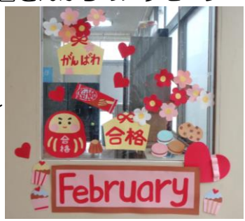
1階やまびこ学級入口