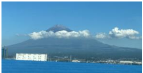
車窓からの富士山

文部科学大臣からいただきました賞状は、下足室奥に掲示しておりますので、ご来校の際にご覧ください。また、東京に行く際に、新幹線の中から富士山が綺麗に見えたので、写真を掲載いたしました。