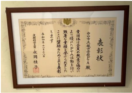
下足室に飾っている表彰状

梶中学校は、昨年度、守口市PTA協議会主催の「守口市PTA研究大会」において、「PTA活動と今後の課題について」と題して、今までのPTAとしての学校との関りや活動について報告(梶中学校の紹介や生徒会活動、地域との連携も含む)をし、PTA活動の課題を提言しました。今年度となり大阪府より守口市の中から推薦団体を出してほしいということで、昨年度の梶中学校の発表を基にして、守口市が国に推薦書を提出したところ表彰されるにいたりました。日本全国で、数多くある学校の中で、賞をいただけたことは非常に光栄なことと考えています。今現在、新型コロナウイルス感染症の影響で、多くの活動が出来ていない状況ですが、生徒たちが学校生活を送る上で、PTA活動は重要な役割を果たしていると考えています。学校・家庭・地域が一体となってこそ生徒たちは健全に成長していくものと考えています。これからも生徒たちのためのPTA活動となるよう保護者の方々との連携を進めていこうと考えています。今後も、生徒たちのために学校の教育活動についてご理解とご協力を賜りますようお願いいたします。