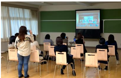
3年生舞台発表のビデオ上映

さて、いよいよ進路選択の時期を迎えた進路説明会では、進路担当より、学校選びについて、入試制度について、入試日程についてなど多岐にわたって説明させていただきました。最近、大きな入試制度の変更はありませんが、保護者の方々から中学生の頃と比べますと大きく変わっており、かつ複雑になっています。各教員も生徒への指導や保護者の方々からの質問等に答えられるよう日々勉強しております。入試についてご不明な点がございましたら、お問合せいただきますようお願いいたします。