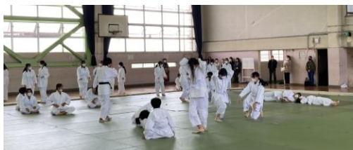
柔道の参観の様子

1学期は、水泳の授業も参観していただくことも出来ましたので、偶然とは言え、いい時期の参観であったような気がします。