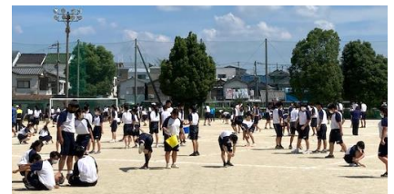
グラウンドの石拾い

今までにもお伝えしていますが、熱中症予防には、水分の補給だけでなく塩分を摂取することが大切であるとも言われています。十分な睡眠を取らせていただくとともに、当日の朝食は必ず食べるようにご家庭で指導していただきますようお願いいたします。その際、お味噌汁をご用意していただければ、塩分の補給も出来るのではと思います(別な食品でも構いませんが当日朝の塩分摂取をお願いします)。