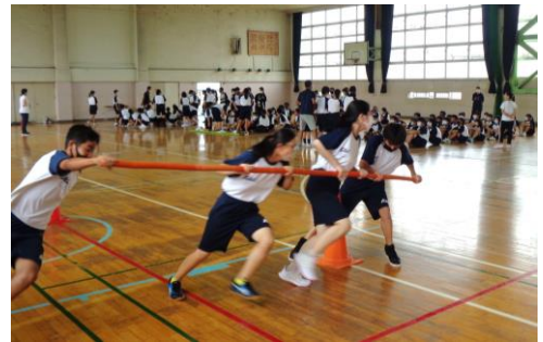
1年生(台風の目)の練習の1コマ