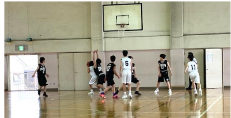
男子バスケットボール部