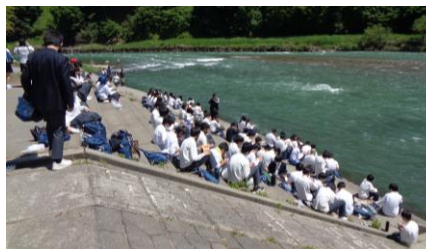
ラフティングの場所での昼食