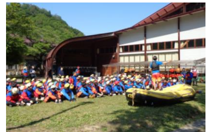
ラフティングの説明