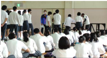
キャンドルサービスの練習