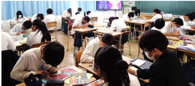
2年生(モザイクアート)