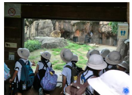
1年 校外学習（天王寺動物園）