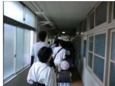
日曜参観 引き渡し訓練