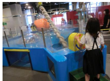
2年 校外学習（キッズプラザ）