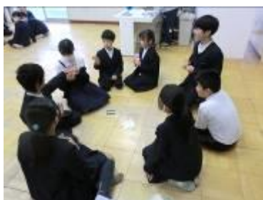
なかよし班活動（室内）