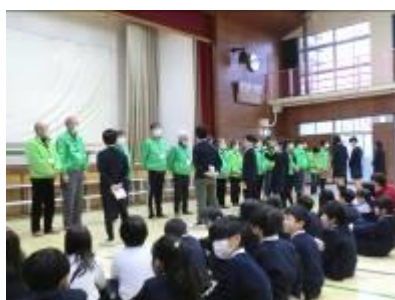
集会「感謝の気持ちを伝えよう」

保護者の皆様・地域の皆様、 学校教育活動にご理解ご協力 ご支援をいただきまして ありがとうございました。