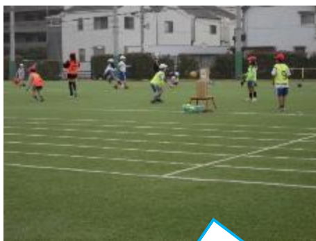
3年：体育 「ポートボール」でパスの練習です。