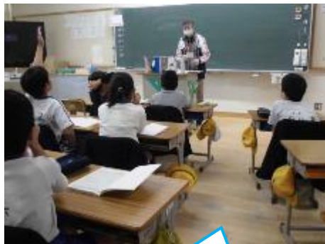
4年：算数 箱の仲間分けをしています。