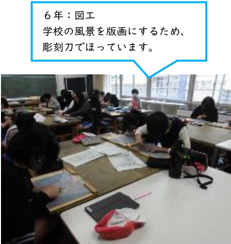
6年：図工 学校の風景を版画にするため、彫刻刀でほっています。