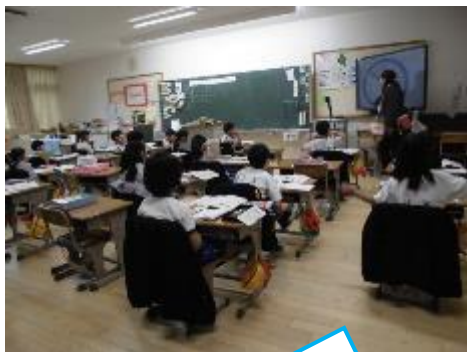
1年：算数 時計のしめもりのよみかたの学習です。