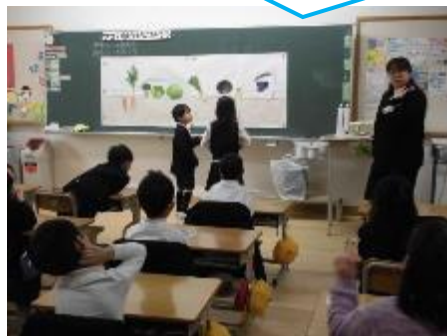
1年：食育 「やさいはかせになろう」で、野菜がどこで育っているかを学習しています。