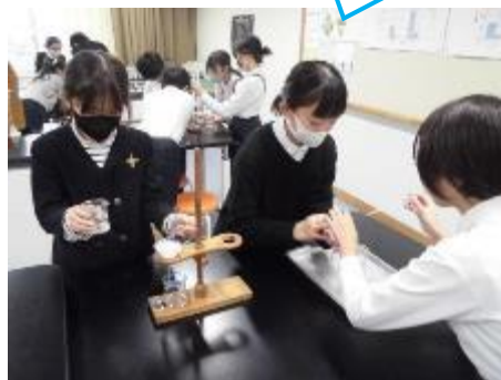
5年：理科 水溶液のろ過をする実験です。