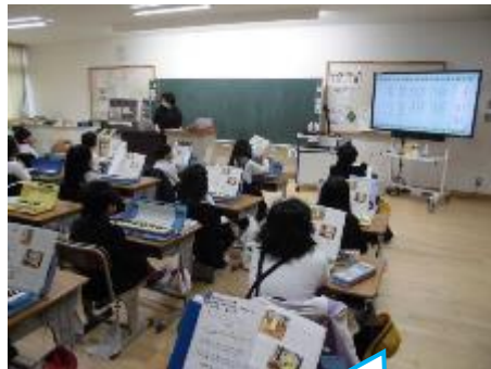
2年：音楽 校歌3番の歌の練習をしています。