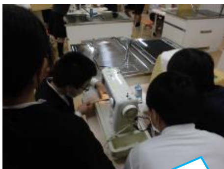
6年：家庭 タオルをきって、ミシンで雑巾を縫っています。