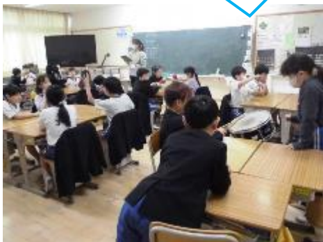
3年：理科 「音のせいしつ」で楽器を鳴らしています。