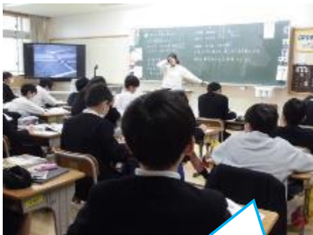
6年：社会 「どのように戦争が終わったか」の学習です。