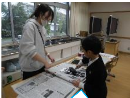
2年：図工 紙版画のインクを付けています。