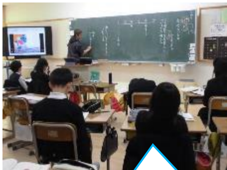
4年：国語 「初雪のふる日」でこの物語の名作得点を付けるなら何点か？で自分の得点を理由とともに発表しています。