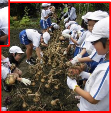
収穫した玉ねぎが14日の給食「そばろ煮」で使用されました。じゃがいもは、21日に使用されます。

6年生は、「元気な体、朝からだ！～わくわく朝ごはん～」の学習を栄養教諭としました。保護者の皆さまのご協力、ありがとうございました。また、家庭科で調理実習「いろどり炒めを作ろう」をしました。「おいしそうに盛り付けよう。」と栄養教諭から声かけがあり、盛り付けも工夫していました。