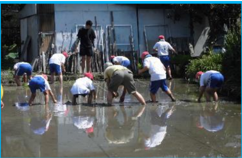
16日 玉ねぎとじゃがいもの収穫体験をさせていただいた地域の方が、田んぼを作ってください、5年生が田植えの体験をしました。もち米の苗を植えました。おいしいもち米が実ることが楽しみです。