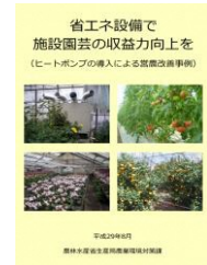
▲省エネで収益力向上を