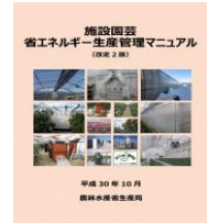
▲省エネマニュアル