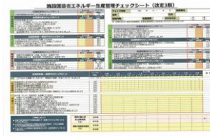
▲省エネチェックシート