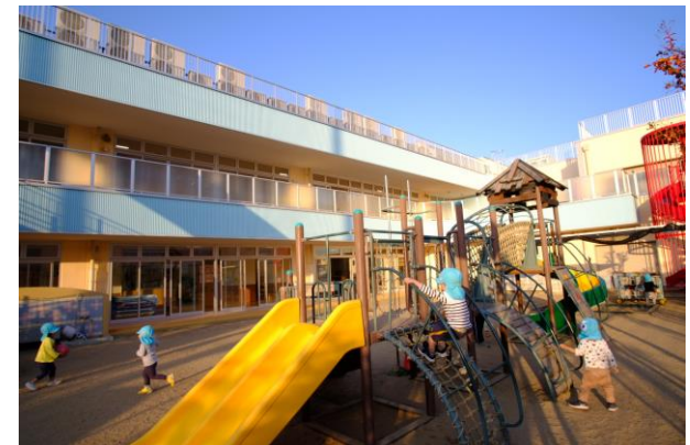
▲市立認定こども園

※掲載事業は一例です。その他の事業も実施しておりますので、詳細は企画課までお問い合わせください。