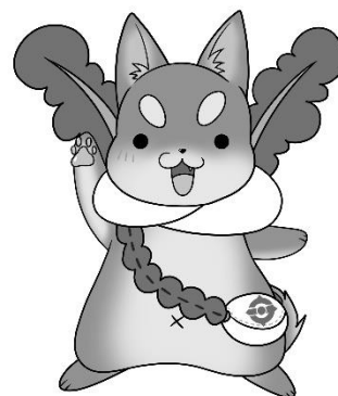
守口市シンボルキャラクター「もり吉」