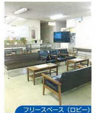
フリースペース(ロビー)