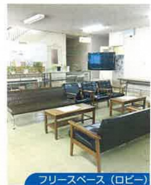
フリースペース(ロビー)