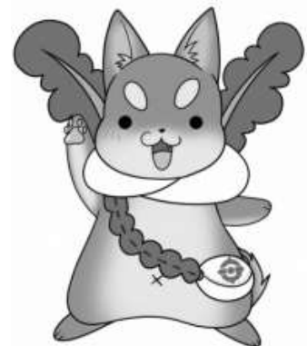
守口市シンボルキャラクター「もり吉」