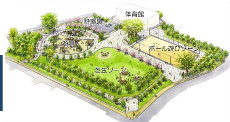
【よつば未来公園整備イメージ（案）】