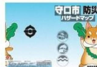
▲市内全世界にハザードマップを配布（R1）