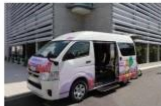
▲コミュニティバスの運行開始