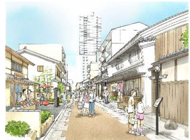
▲にぎわいのある文禄堤のイメージ

※掲載事業は一例です。その他の事業も実施しておりますので、詳細は企画課までお問い合わせください。