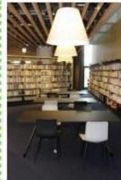
▲守口市立図書館の開館（R2）