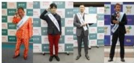
▲もぐち夢・未来大使を任命