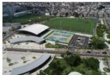
▲大枝公園のグランドオープン