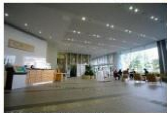
▲新庁舎に移転（1階ロビー）