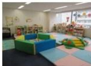
▲子育て世代包括支援センターの開設（R1）