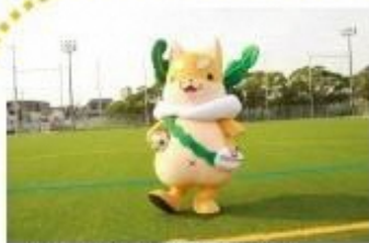
▲守口シンボルキャラクター「もり吉」の誕生