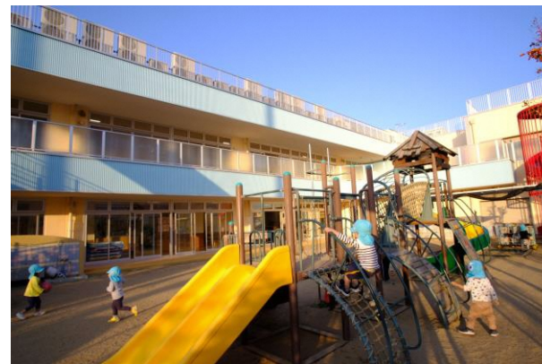
▲市立認定こども園

※掲載事業は一例です。その他の事業も実施しておりますので、詳細は企画課までお問い合わせください。