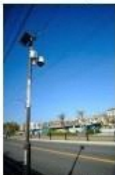
▲府内最大規模！110mに1台 市内に防犯カメラ1,000台を設置