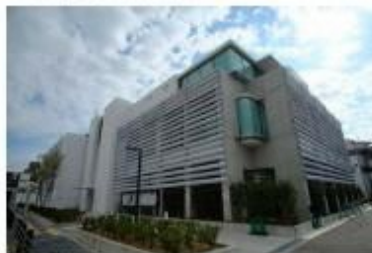
▲東部エリアコミュニティセンターの開設