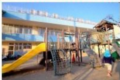
▲国に先駆け、幼児教育・保育の無償化を実施！