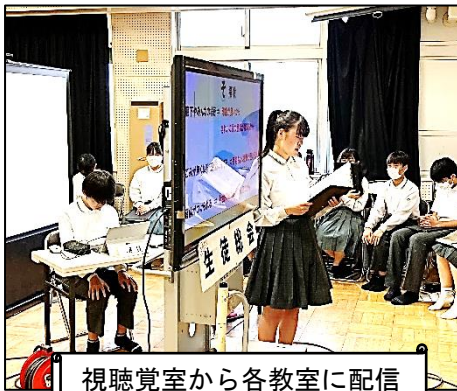
視聴覚室から各教室に配信

感染予防で全校生徒が体育館に集まることができない状況が、昨年から続いています。生徒会執行部の体制も整い、各委員会への要望について学級討議と「校則」をテーマに熟議が6月18日に行われました。そして今回は、Zoomを活用して、生徒会執行部各委員長からの回答と熟議のまとめを各学年の代表が発表してくれました。全校生徒が各教室で見守る中、テキパキ・ハキハキと各委員長が発言し、立派な生徒総会でした。