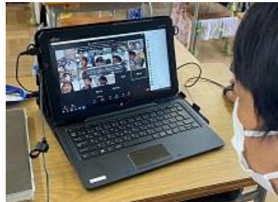
3年生は、先生が出した問題に対して「挙手」ボタンを使って答えていました。