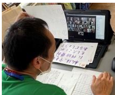
5年生は、クイズやしりとりで楽しみました。チャットを使ってヒントを出し合う様子も…。