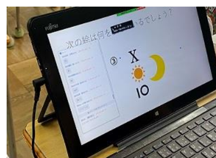
6年生は、ビンゴゲームやクイズで楽しみました。回答はチャットで…。画像の問題わかりますか？ …答え「朝」