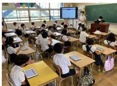
1年生と2年生は、教室でZoomのつなぎ方やオンラインのドリル問題などに取り組みました。

本配布いたしました「守口市教育委員会」発行のプリントにあるように、次回 8月6日(金)9:00より 、「守口市一斉オンライン接続テスト」を実施いたします(実施方法については、以前本校より 6月18日付で配布 したプリントと同じ内容です)。また、このテストに当日参加いただいたご家庭につきましては、プリントに記載がありますように、 簡単なアンケート につきましても併せてご協力をお願いいたします。