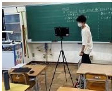
4年生は、連絡帳の記入後、先生からの解説を聞いてドリルに取り組みました。