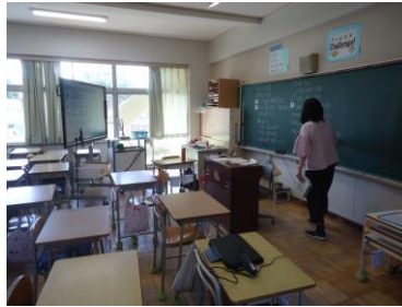
＜オンライン授業の様子（４年生）＞