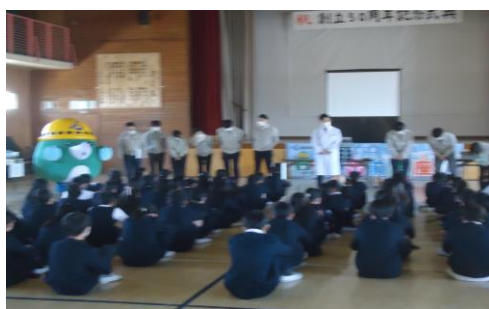
<阪神高速出前授業（5、6年生）>