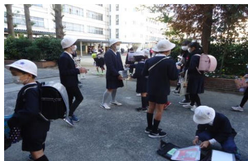
<児童会ユニセフ募金>