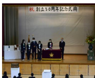
＜周年行事実行委員会＞