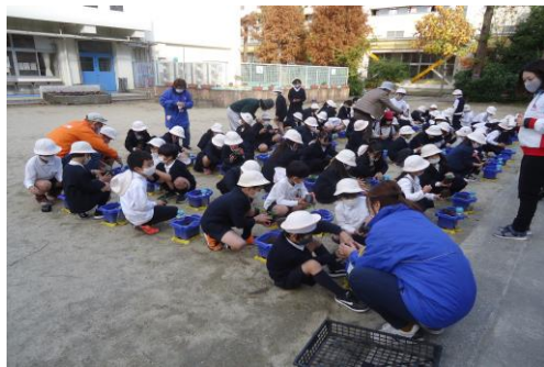
<花の苗交流（桜の園・2年生）>