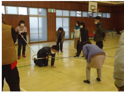
<教職員による研修>