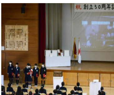
＜6年生のメッセージ＞