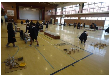
<1・2年生なかよしフェスティバル>