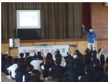
< 薬物乱用防止教室 (6年) >