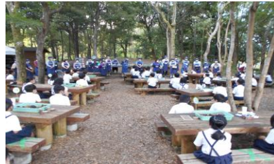
< 4年生 万博記念公園 >