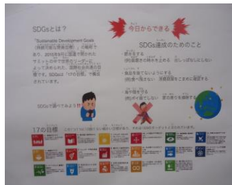
< 一中生によるSDGsポスター >