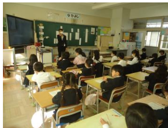
< 授業 (教職員研修) ICT >