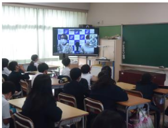
< サイバー防犯教室 (4年) >