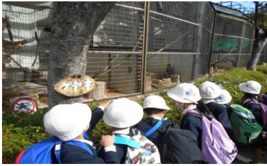
< 1年生 天王寺動物園 >