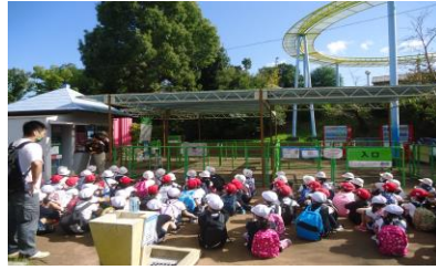
< 2年生 ひらかたパーク >