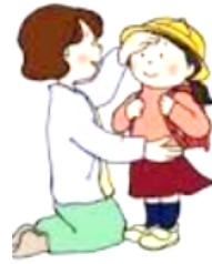
1、家庭での健康観察