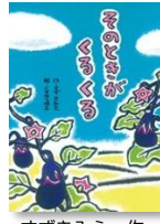
すずきみえ 作 文研出版