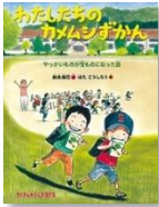
鈴木海花 文 福音館書店

アフリカの水くみをする女の子の1日をえがいています。すべてのくみで、きれいであぜんんな水をつかえる日がきてほしいものです。