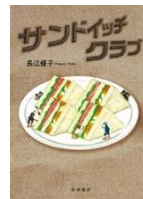
長江優子 作 岩波書店

カラスには、毎日の時間割があったり、遊びを発明したり、子そだてをがんばったり…知れば知るほど、カラスのことがおもしろくなるかも！？