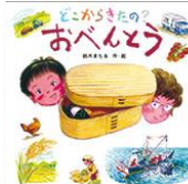
鈴木まもる 作 金の星社

みんな、きれいなたべものがあるよね？きれいなたべものがあったってこまっけていても、この本をよんだらちょっとたべてみたくなるかも？