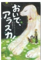
アンナ・ウォルツ 作 フレーベル館

子馬のポンコは長老の木・エカシと不思議なカメムシたちと森でくらしている。ある日ポンコは川の水の声も風の音が違うことに気づく。大人になろうとしているポンコを描く。