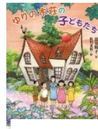
富安陽子 作 講談社

みんなのおべんとうのなかみは、どこからきて、どうやってたべられるようになったの？ひとつのおべんとうからいろいろなつながりがみえてきます。