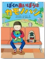
ビヤル・エグラー 作 徳間書店

あのくさい虫「カメムシ」。学校のまわりを探してみたら、35種類も見つかった。みんなで「カメムシずかん」をつくっちゃったほんとうにあったお話です。