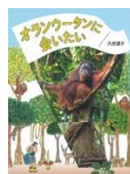
久世濠子 著 あかね書房

小6の珠子はダブル塾通い。ある日公園で無心に砂をけずって砂の像を作っている、ヒカルと出会う。性格や生活環境も違う2人がお互いを認め成長していく。