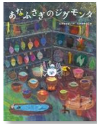
とみながまい 作 ひさかたチャイルド