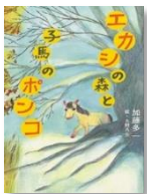
加藤多一 作 ポプラ社

ルフスは、人間のことばを話すカモノハシと出会います。動物園からにげだしたというカモノハシにたのまれ、オーストラリアに帰るのを手伝うことに！