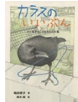
嶋田泰子 作 童心社

老人ホーム「ゆりの木荘」にすむサクラさんはとつぜん、10さいの子どもになってしまいました！77年前の「あの子」との約束をはたすために…。