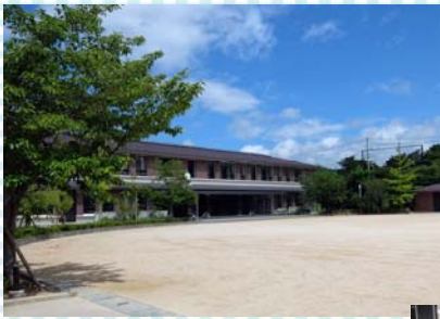
同志社小学校 地上2階建、2006年4月開校

7月21日(木)に、オープンスペースの使い方や、展示・掲示の 設えなど参考となる事例の学校へ視察に行きました