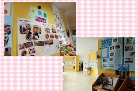
掲示の工夫 子どもたちの作品など展示物が掲示できるような設えとなっていました。