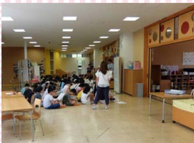
オープンスペースの活用例① 普通教室前のオープンスペースでは、学年集会を行えるくらいの大きさがありました。