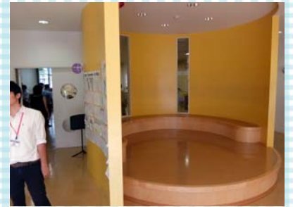
デン 「隠れ家」を意味するデン。校舎のあちこちに配置され、子どもたちが自由に入って遊んだり、話をしたりして活用されています。