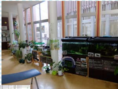
玄関と玄関前展示コーナー 明るく開放的な玄関空間。 向いは水槽等の展示コーナー になっていました。