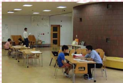
オープンスペースの活用例② オープンスペースを使って子どもたち一人ひとりに通表を渡すスペースとしても活用されています。